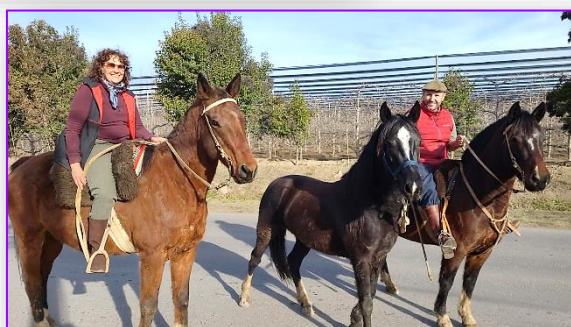
Catequistas gauchescos de Cristo