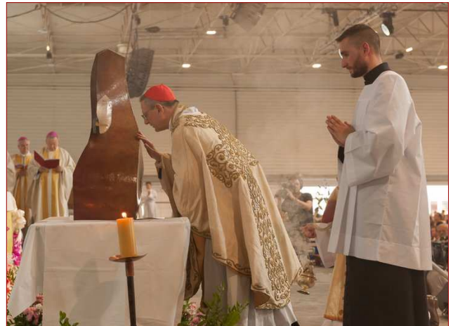
Cardenal Amato venera las reliquias de madre Adela al final de la misa de beatificación.