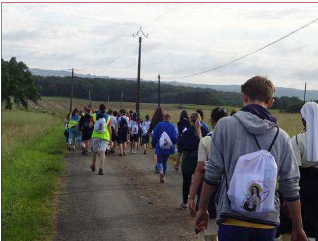
Peregrinación de jóvenes durante la beatificación.

Los jóvenes presentes en la marcha habían venido del colegio Sainte-Foy de Agen, animado por las Hermanas marianistas, pero también de muchos jóvenes de parroquias de toda la diócesis. Es el fruto de un trabajo generoso y paciente del obispo de Agen, Mons. Herbreteau, que quiso, antes de la beatificación, ir a presentar a Adela a todas las parroquias de su diócesis, y en las reuniones de jóvenes o en celebraciones de confirmación. La figura de Adela se hizo así más familiar para muchos y el arraigo de su san-