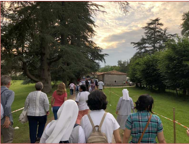
Peregrinos a la llegada al château de Trenquelléon para asistir al espectáculo teatral sobre la vida de Adela.