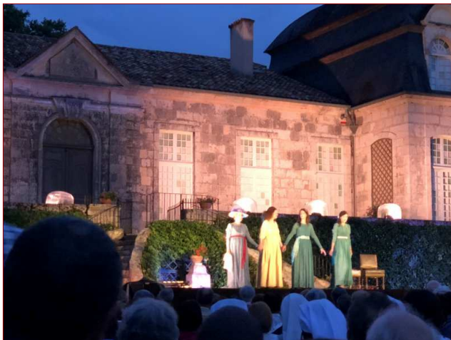
Representación teatral de la vida de la joven Adela en el château de Trenquelléon.