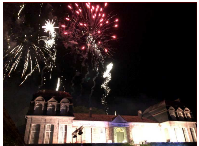
Fuegos artificiales sobre el château de Trenquelléon al final del espectáculo teatral.