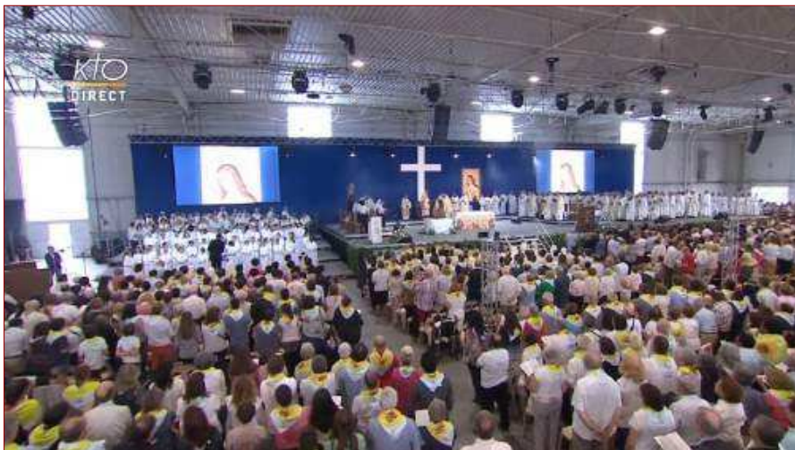
Vista general de la asamblea durante la misa de beatificación.