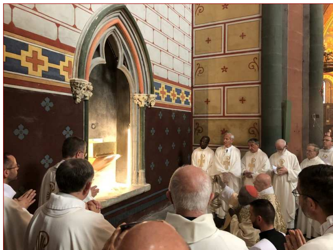
Momento final de la misa de acción de gracias en la catedral de Agen. El cardenal Sarah incienso las reliquias de la beata María de la Concepción.