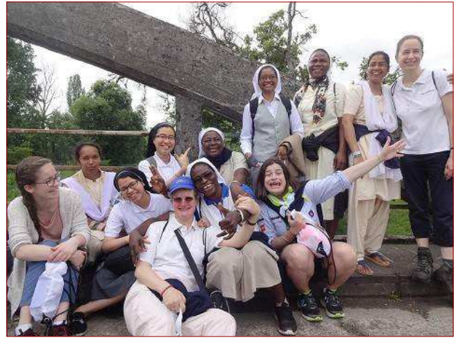
Grupo de jóvenes religiosas marianistas durante la beatificación.

idad en este terruño se ha hecho más manifiesta. Su carácter, su personalidad y su generosidad hablan al corazón de los jóvenes de hoy: al fundar la "Pequeña sociedad", ella hizo de la amistad un camino para encontrar a Dios, y continúa haciéndolo hoy.