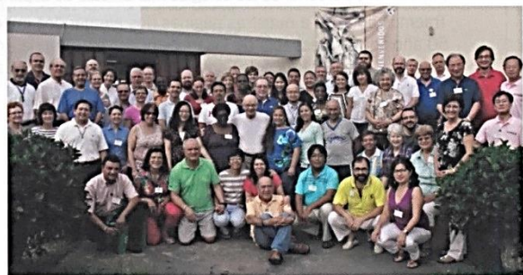
Participantes en el VI Encuentro mundial de las CLM (Perú, 2014)

La Familia marianista es una realidad pequeña. No se puede comparar a los grandes movimientos eclesiales actuales como los neocatecumenales, los focolari, los movimientos carismáticos y las diversas familias vinculadas a las grandes congregaciones